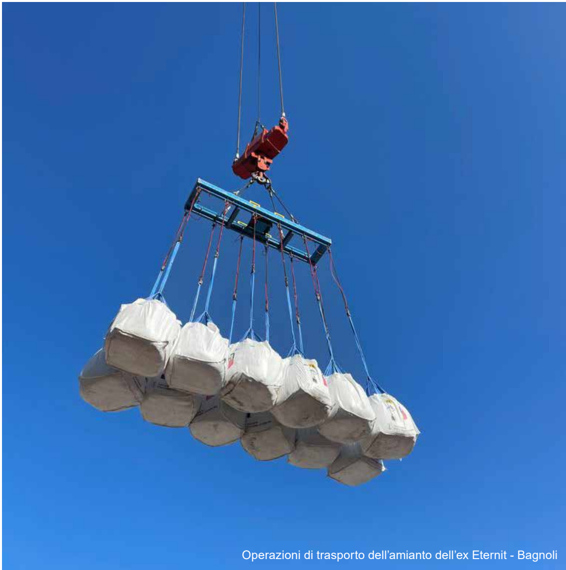
Operazioni di trasporto dell'amianto dell'ex Eternit - Bagnoli

La forza e il futuro di Teorema S.p.A. si fondano sulle sue persone. La Società assicura a tutti le medesime opportunità, garantendo un trattamento equo basato su criteri di merito, senza discriminazione alcuna e nel pieno rispetto delle leggi e delle normative di settore. Nella gestione delle risorse umane sono garantiti la libertà di associazione ed il diritto alla contrattazione collettiva e la decisione di aderire ad un'organizzazione di propria scelta è libera e non comporterà conseguenze negative per il personale, né ripercussioni da parte dell'azienda. La Società inoltre adotta le più moderne tecniche di supporto alle parti interessate, in particolare perseguendo una costante attività di formazione ed aggiornamento del management aziendale e dei dipendenti e rispettando la normativa sulla sicurezza sui luoghi di lavoro.