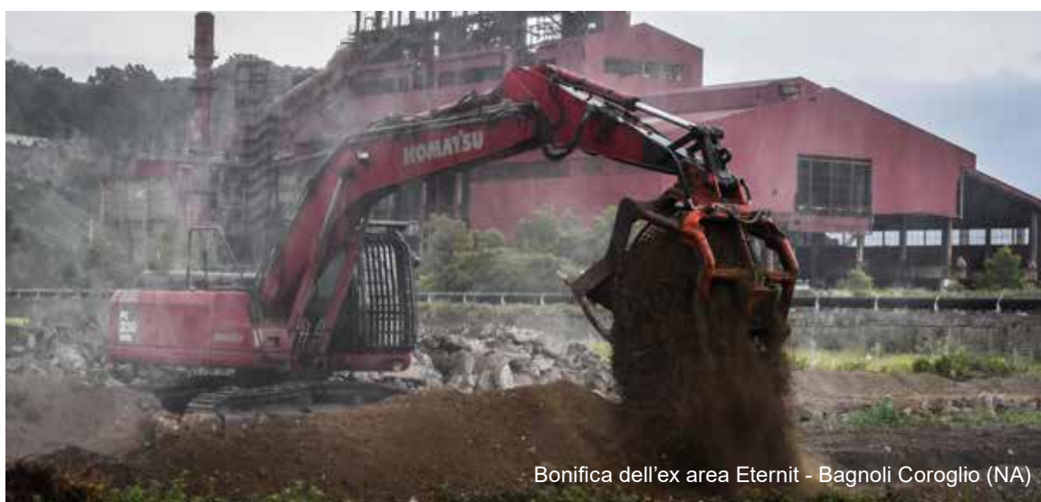
Bonifica dell'ex area Eternit - Bagnoli Coroglio (NA)

duce una definizione chiara ed esplicita delle proprie responsabilità etiche e sociali verso tutti i soggetti coinvolti direttamente o indirettamente nell'attività della Società (clienti, fornitori, soci, cittadini, dipendenti, collaboratori, istituzioni pubbliche, associazioni ambientali e chiunque altro sia interessato dall'attività dell'azienda). Il Codice rappresenta le misure che Teorema S.p.A. intende adottare sotto un profilo etico-comportamentale , al fine di adeguare la propria struttura ai requisiti previsti dal Decreto Legislativo n. 231/2001 e predisporre delle linee di condotta interne ed esterne alla Società da seguire nella realizzazione degli obiettivi societari. Pertanto, i principi contenuti nel presente documento si aggiungono a quelli previsti dal Modello di Organizzazione, Gestione e Controllo di cui all'art. 6 del D.lgs. 231/01 che la società ha deciso di adottare. Tuttavia, il Codice non sostituisce e non prevale sulle leggi vigenti e sul Contratto Collettivo Nazionale di Lavoro in essere.