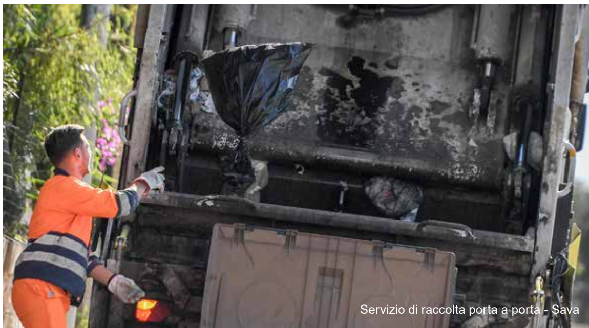
Servizio di raccolta porta a porta - Sava

duce una definizione chiara ed esplicita delle proprie responsabilità etiche e sociali verso tutti i soggetti coinvolti direttamente o indirettamente nell'attività della Società (clienti, fornitori, soci, cittadini, dipendenti, collaboratori, istituzioni pubbliche, associazioni ambientali e chiunque altro sia interessato dall'attività dell'azienda). Il Codice rappresenta le misure che Teorema S.p.A. intende adottare sotto un profilo etico-comportamentale , al fine di adeguare la propria struttura ai requisiti previsti dal Decreto Legislativo n. 231/2001 e predisporre delle linee di condotta interne ed esterne alla Società da seguire nella realizzazione degli obiettivi societari. Pertanto, i principi contenuti nel presente documento si aggiungono a quelli previsti dal Modello di Organizzazione, Gestione e Controllo di cui all'art. 6 del D.lgs. 231/01 che la società ha deciso di adottare. Tuttavia, il Codice non sostituisce e non prevale sulle leggi vigenti e sul Contratto Collettivo Nazionale di Lavoro in essere.