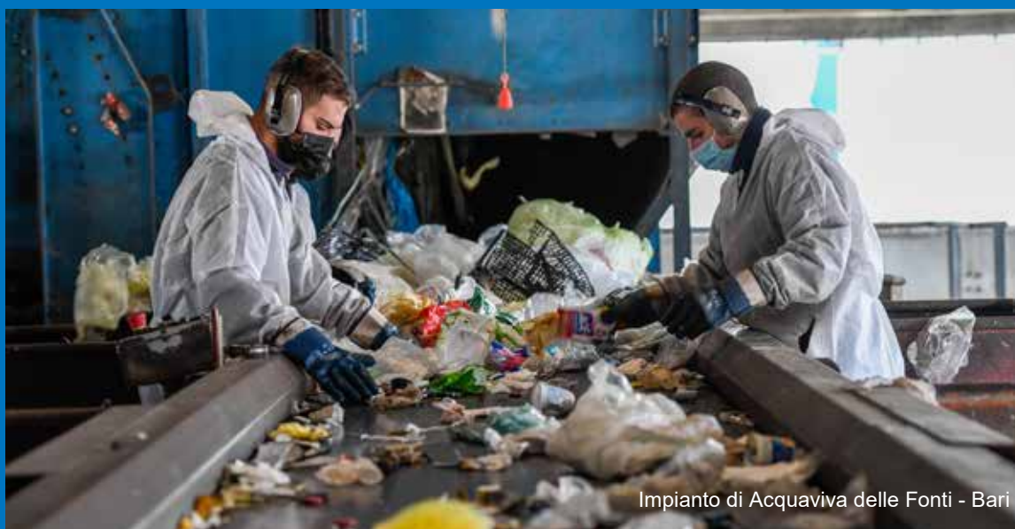
Impianto di Acquaviva delle Fonti - Bari

La correttezza e l' integrità morale sono un dovere indefettibile per tutti i Destinatari, i quali sono tenuti a non instaurare alcun rapporto privilegiato con terzi, che sia frutto di sollecitazioni esterne finalizzate ad ottenere vantaggi impropri. Nello svolgimento della propria attività i Destinatari sono tenuti a non accettare donazioni, favori o utilità di alcun genere (salvo oggetti di modico valore) e, in generale, a non accettare alcuna contropartita al fine di concedere vantaggi a terzi in modo improprio. A loro volta, i Destinatari non devono effettuare donazioni in denaro o di beni a terzi o comunque offrire utilità o favori di alcun genere (salvo oggetti di modico valore oppure omaggi di cortesia commerciale autorizzati dalla Società) in connessione con l'attività da essi prestata a beneficio di Teorema S.p.A. L'intrinseca convinzione di agire nell'interesse della Società non esonera i Destinatari dall'obbligo di osservare puntualmente le regole ed i principi del presente Codice.