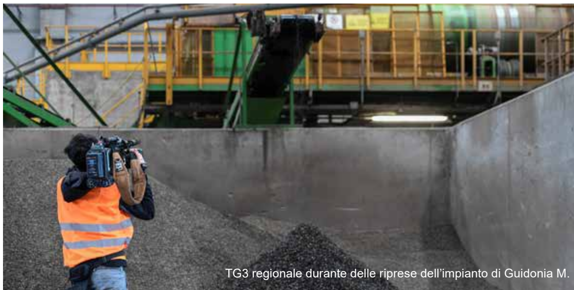
TG3 regionale durante delle riprese dell'impianto di Guidonia M.

I dipendenti non possono, pertanto, fornire informazioni ai rappresentanti dei mass media senza l'autorizzazione delle funzioni aziendali competenti. In ogni caso, le informazioni e le comunicazioni relative alla Società, nonché al complessivo Gruppo, e destinate all'esterno dovranno essere accurate, veritiere, complete, trasparenti e tra loro