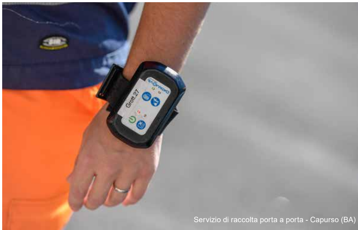
Servizio di raccolta porta a porta - Capurso (BA)

Le sanzioni irrogabili saranno applicate nel rispetto di quanto previsto dalla Legge e dal Contratto Collettivo Nazionale di Lavoro applicato. Tali sanzioni saranno erogate in base al rilievo che assumono le singole fattispecie considerate e verranno proporzionate alla loro gravità. L'accertamento delle suddette infrazioni, la gestione dei procedimenti disciplinari e l'irrogazione delle sanzioni restano di competenza delle funzioni aziendali a ciò preposte e delegate.